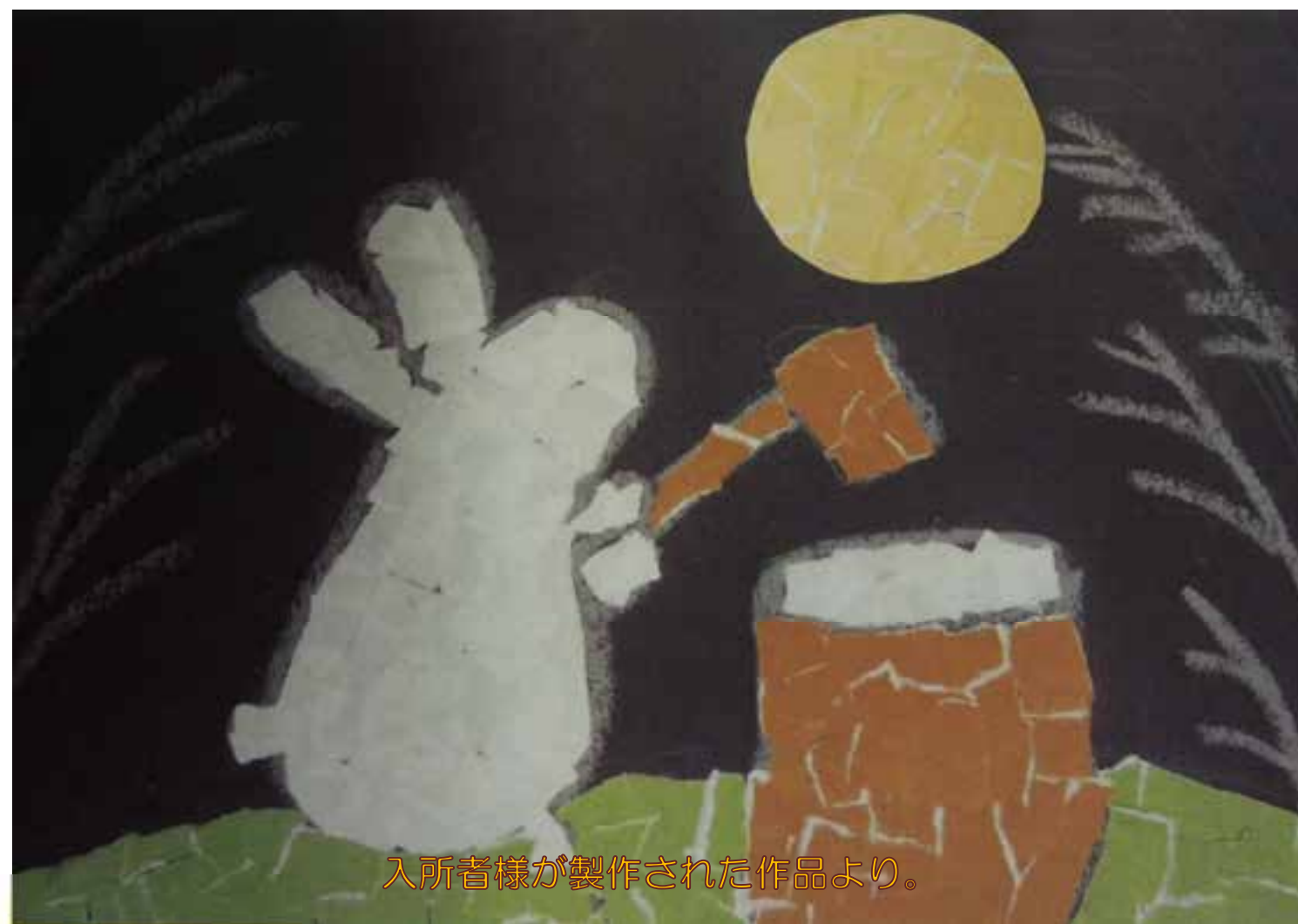
入所様が製作された作品より。