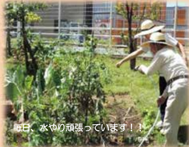
毎日、水やり頑張っています！！