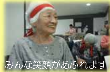
みんな笑顔があふれます